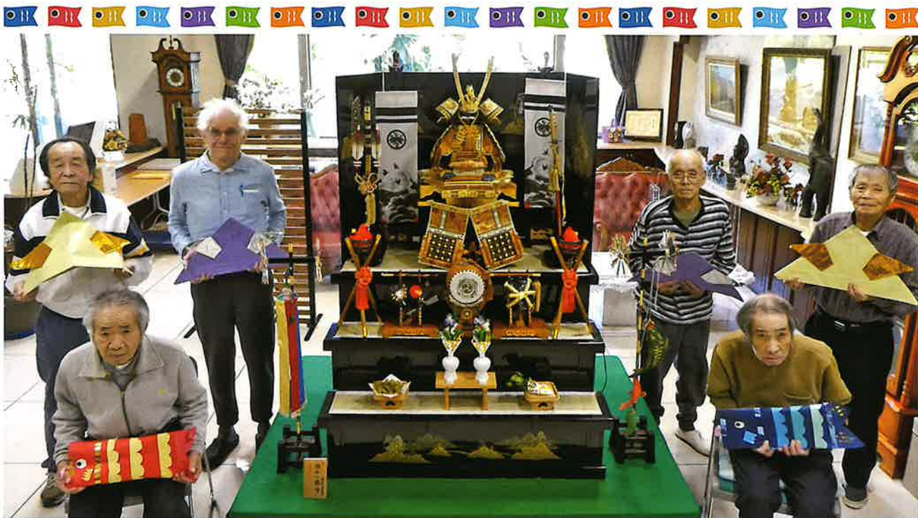
端午の節句(令和4年5月5日)

第112号 令和4年6月15日 発行所 神奈川県三浦市 初声町下宮田1846 社会福祉法人 阿部睦会 美山ホーム TEL 046-888-3048 E-mail miyama2@h2.dion.ne.jp URL https://miyamaho-mu.jp/ 発行人 濱岡 武